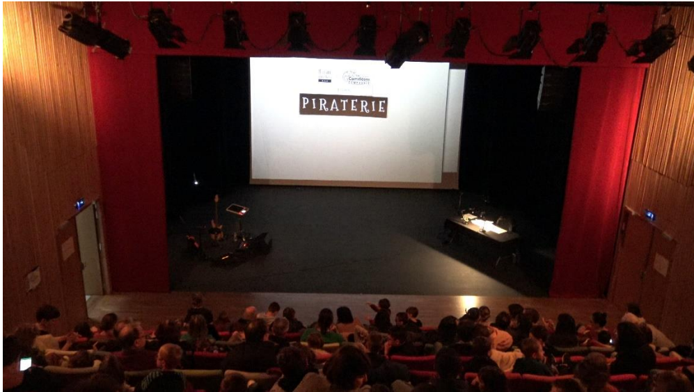
1 - Photo implantation de la scène. A jardin, le musicien. A cour, le dessinateur. Au lointain, l'écran. Ici le vidéoprojecteur est accroché sur le pont, mais il peut être à même le sol (en projection ou en rétroprojection).