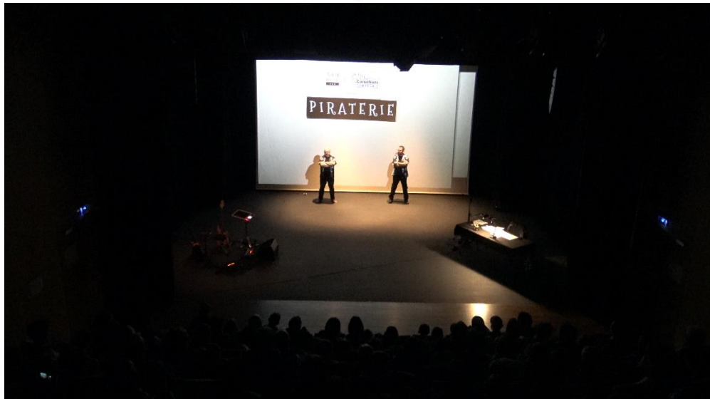
2 - Photo début du spectacle. Utilisation des deux douches au lointain, au ras de l'écran.