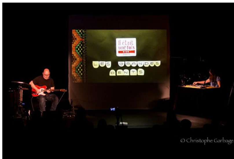
1 - Photo implantation de la scène. A jardin, le musicien. A cour, la dessinatrice. Au lointain, l'écran. Ici le vidéoprojecteur est au sol.