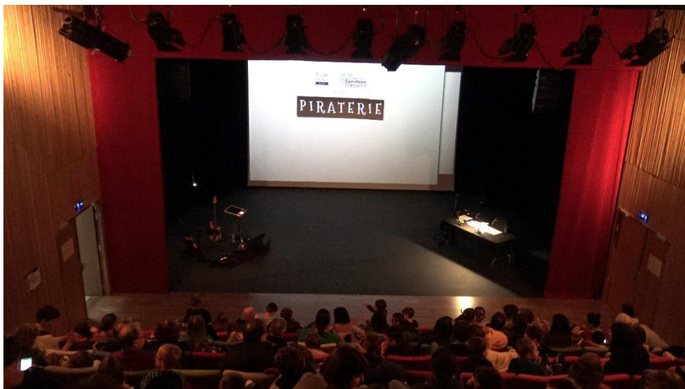
1 - Photo implantation de la scène. A jardin, le musicien. A cour, le dessinateur. Au lointain, l'écran. Ici le vidéoprojecteur est accroché sur le pont, mais il peut être à même le sol (en projection ou en rétroprojection).