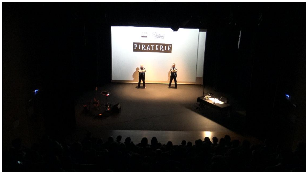
2 - Photo début du spectacle. Utilisation des deux douches au lointain, au ras de l'écran.