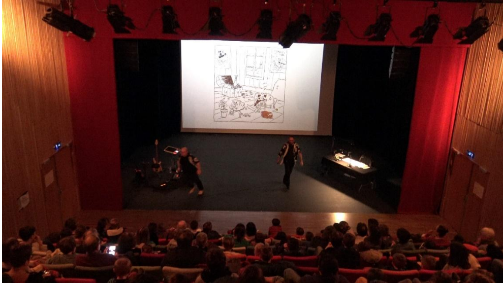
4 - Photo durant le spectacle. un plein feu salle en cours de spectacle. Le musicien et le dessinateur interviennent dans la salle. Puis retour à la configuration Photo 3.